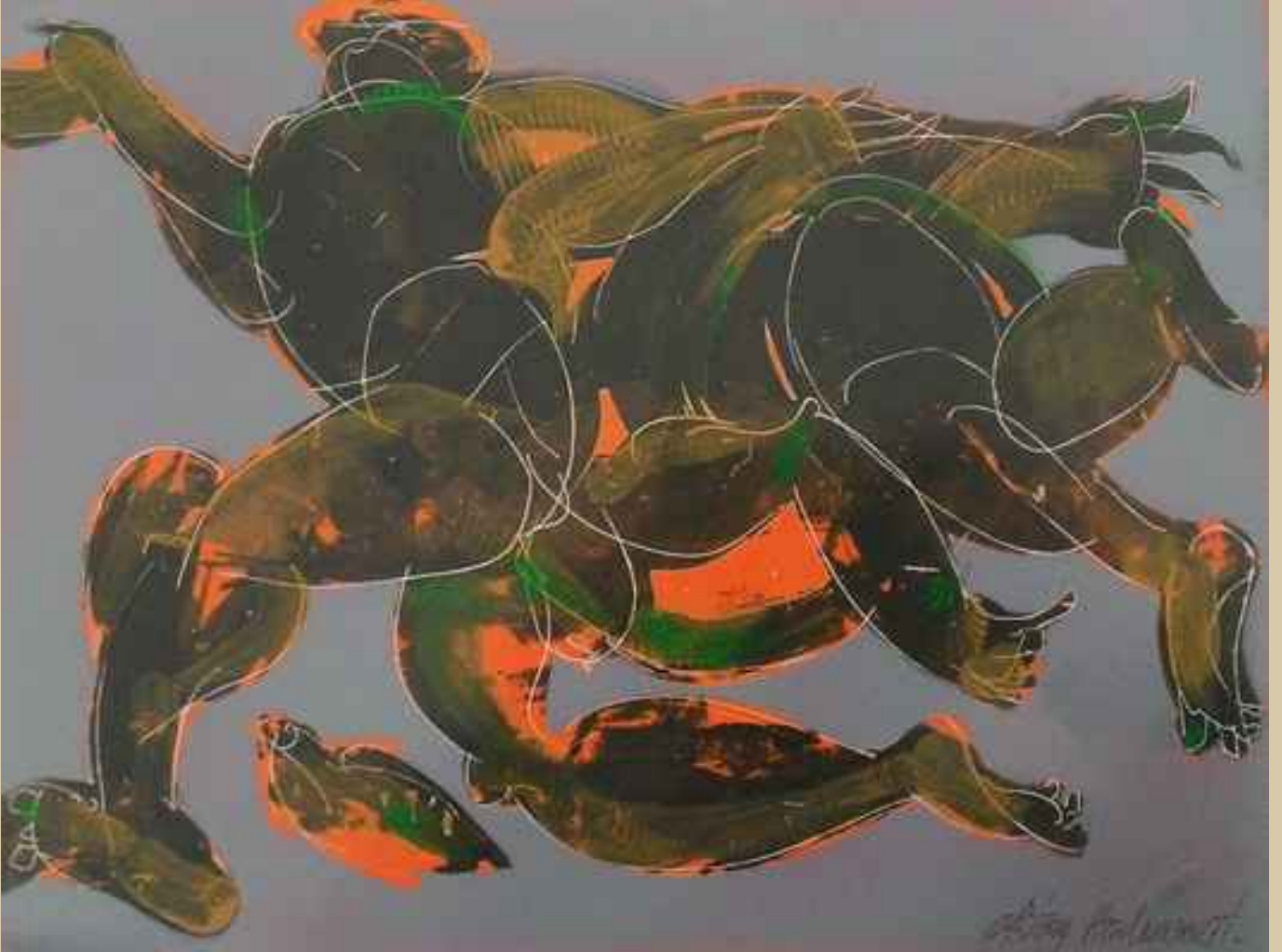
Dolaşanlar, 25x32,5cm, Gravür üzerine yağlı boya ile boyama (karışık teknik)