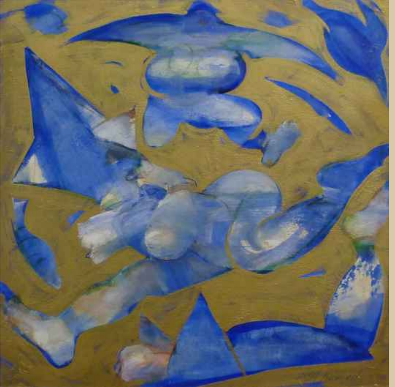
Hava durumu, 2004, 80x80cm., tuval üzerine akrilik, yağlı boya