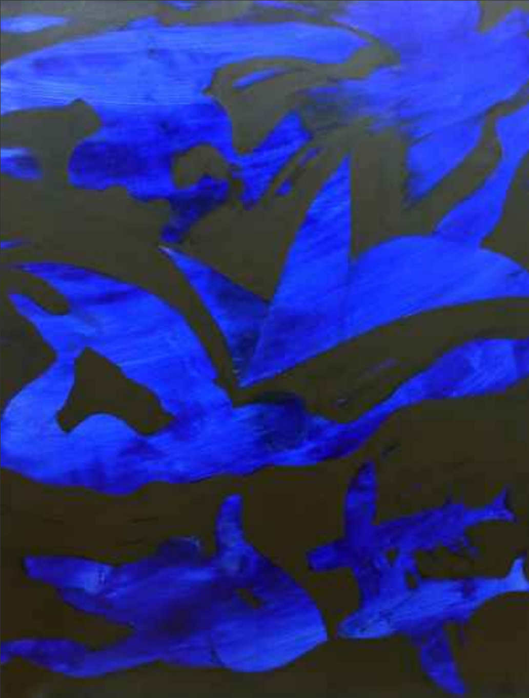
Uçurtma, 2001, 80x80cm., tuval üzerine yağlı boya