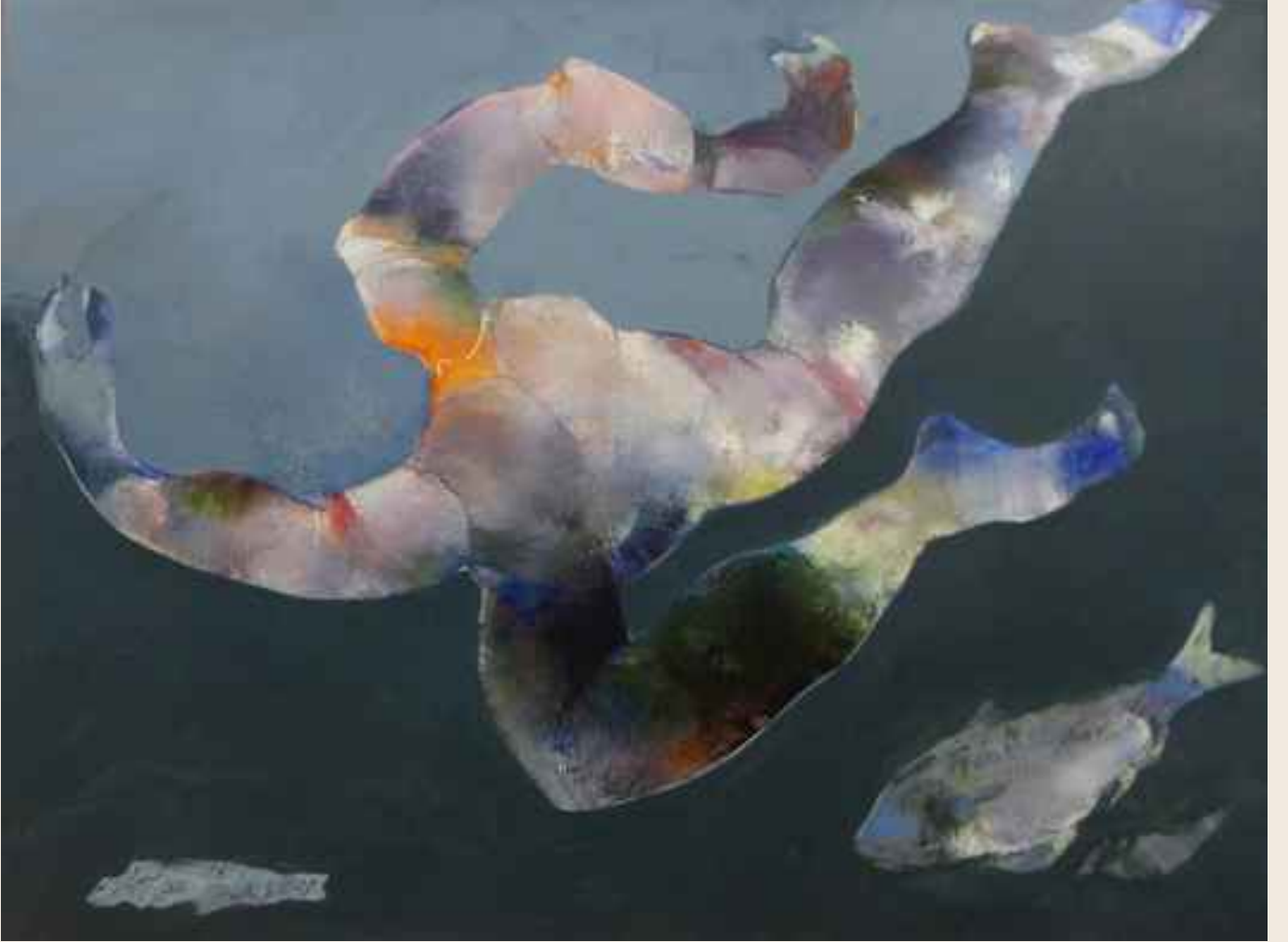
Ahtopot ile balık, 2015, 60x80cm, tuval üzerine karışık teknik