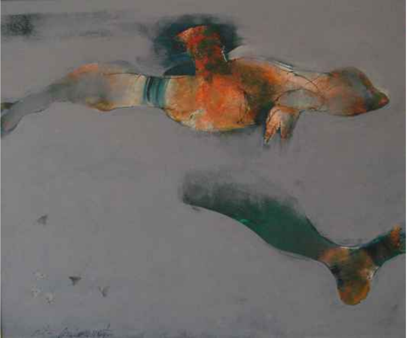
Atlet, 2008, 97x115cm, tuval üzerine karışık teknik