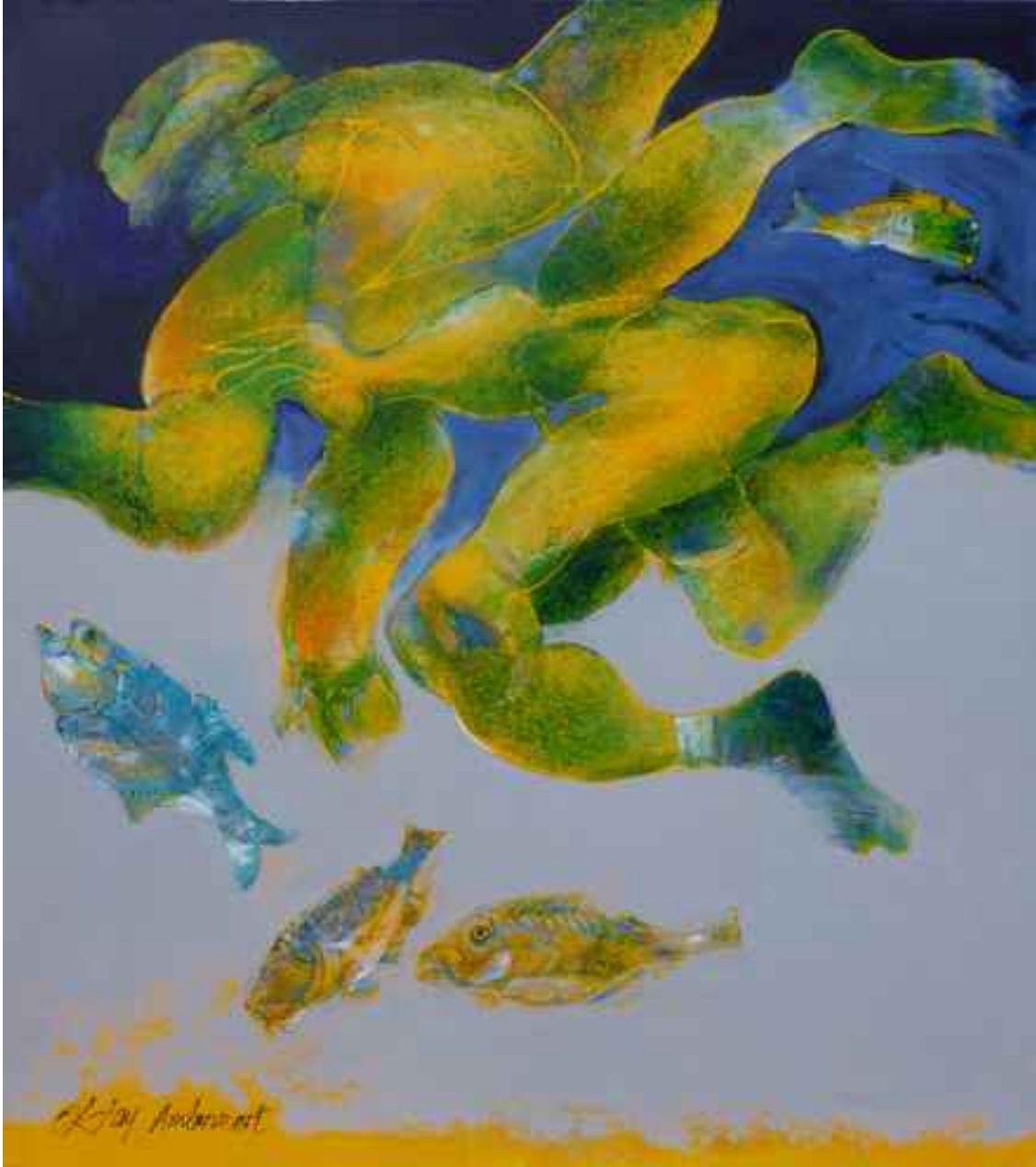
Yaşam içinde, 2015, 90x80cm, tuval üzerine karışık teknik-2