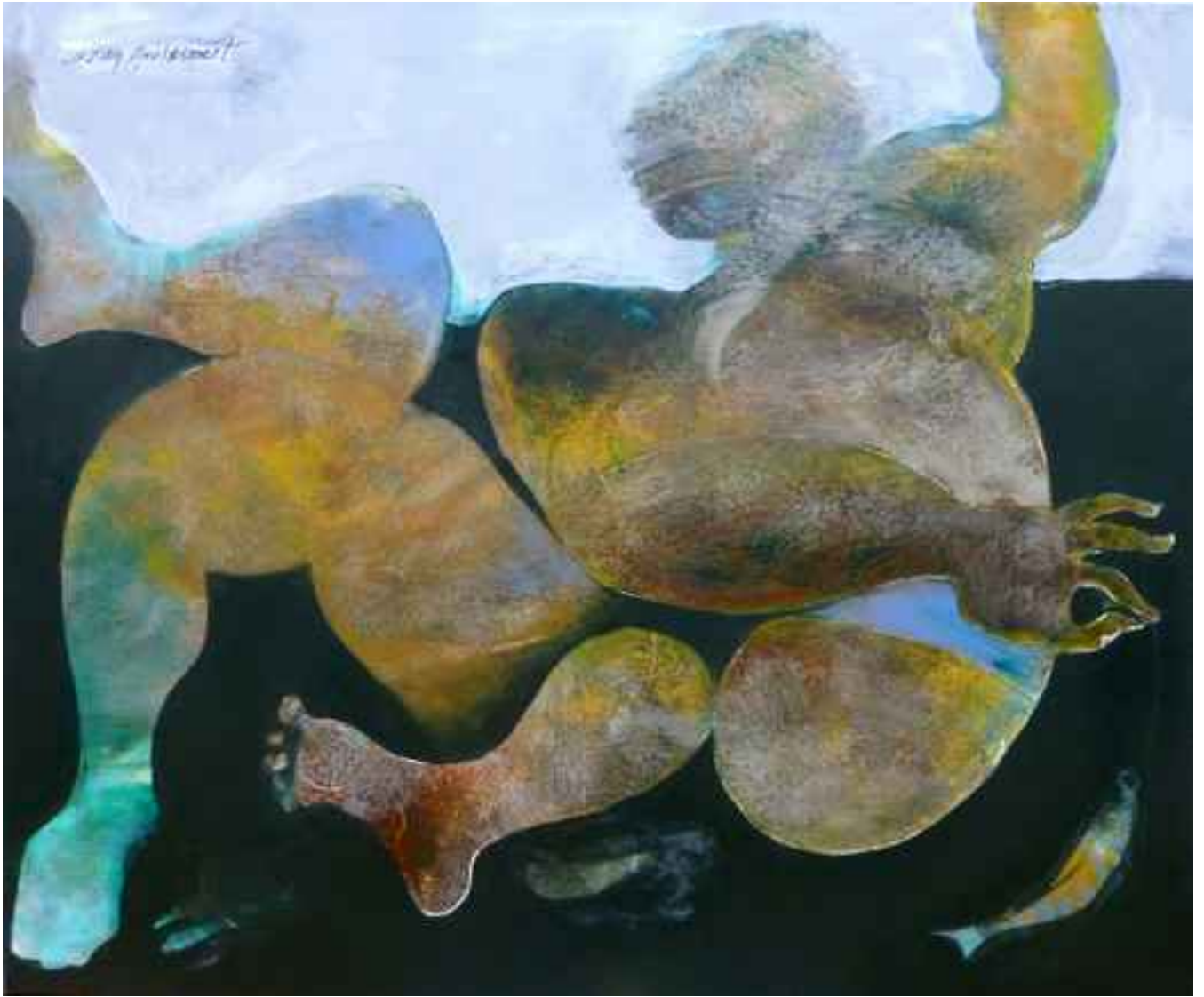
Taşınan bedenler, 2010, 97x116cm, tuval üzerine karışık teknik