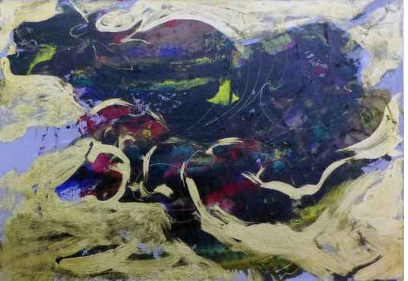
Bosforos efsanesi üzerine düşünceler, 2005, 20x29cm., karışık teknik