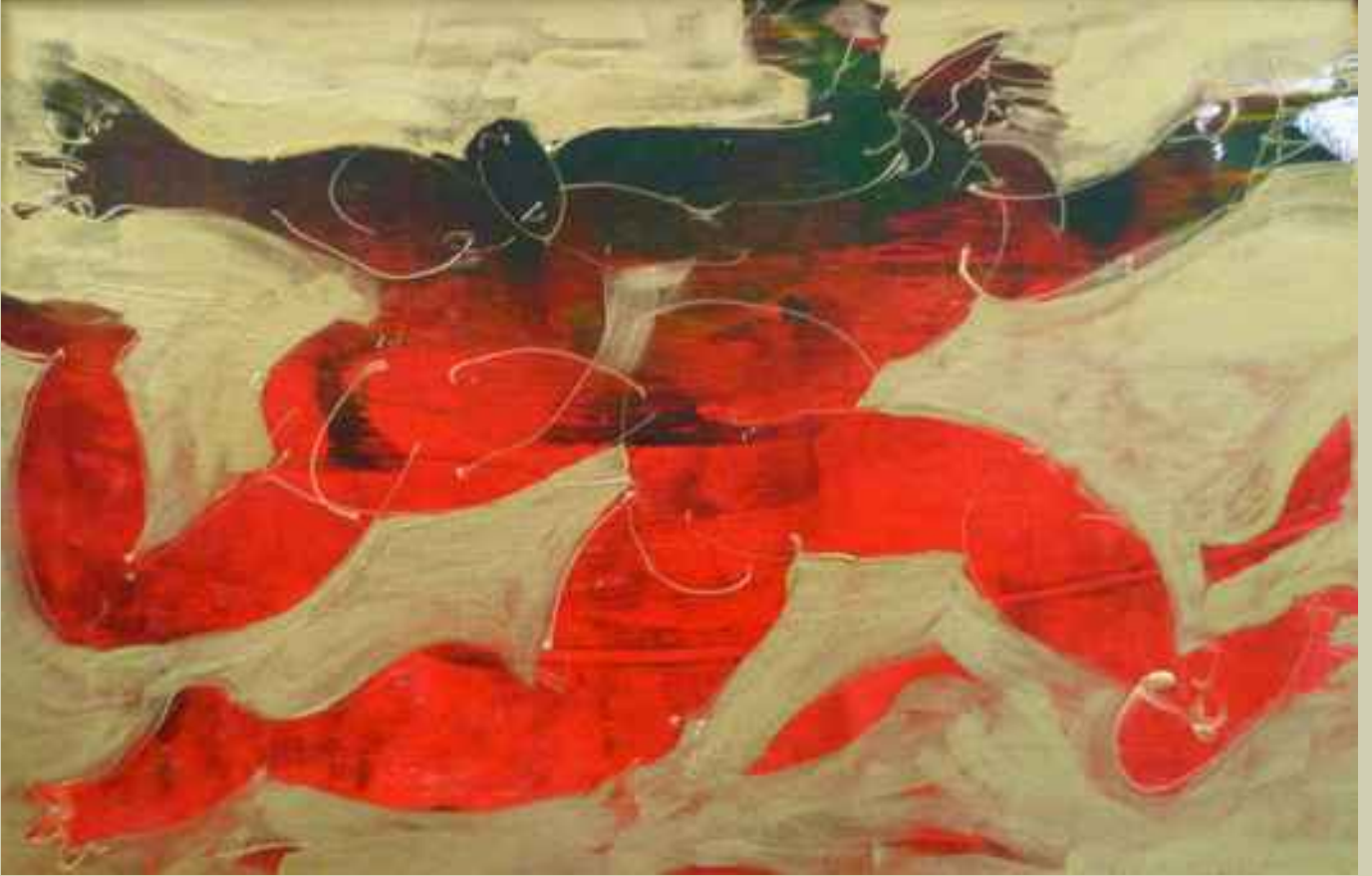
Kovalayanlar 15, 2008, 21,5x32cm., mukavva üzerine karışık teknik