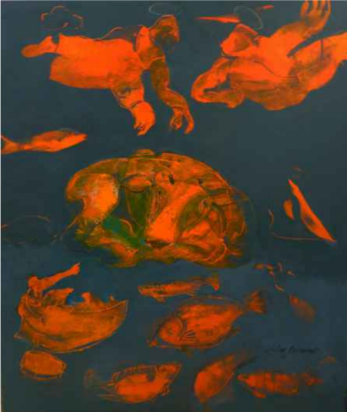
Bosforos efsanesi, 2015 .116x97cm, tuval üzerine karışık teknik