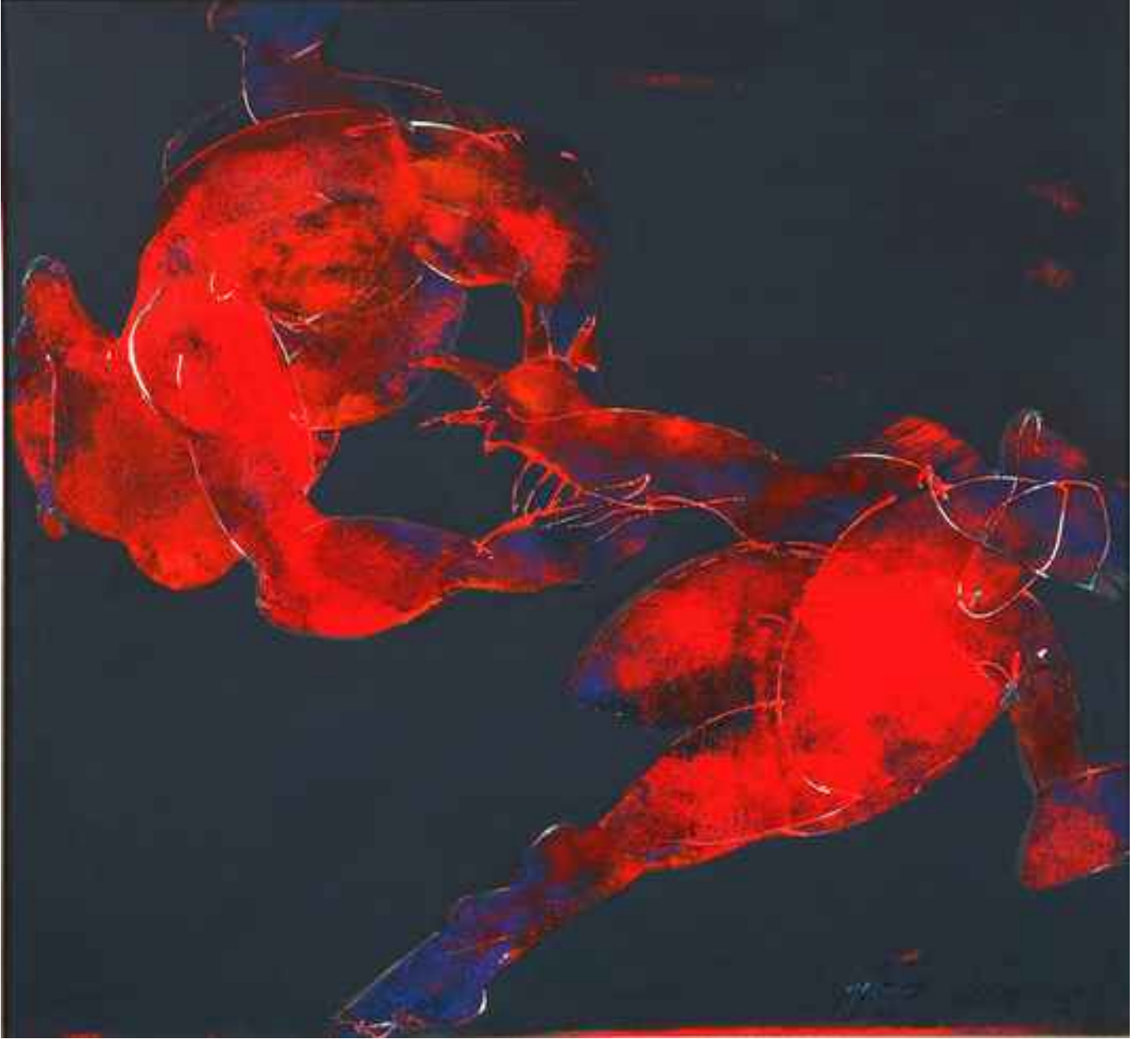
iki figür, 2008, 97x105cm., tuval üzerine karışık teknik