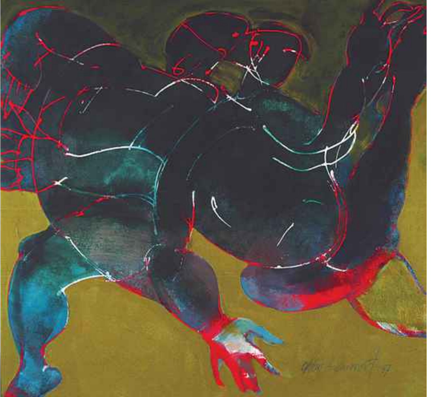
Kararsızlar, 2007, 97x105cm, tuval üzerine karışık teknik.