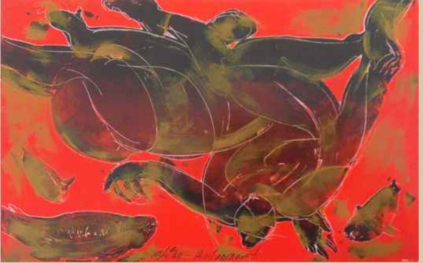
Kırmızı Denizde Dolaşanlar, 20x31cm, Gravür üzerine yağlı boya ile boyama (karışık teknik)