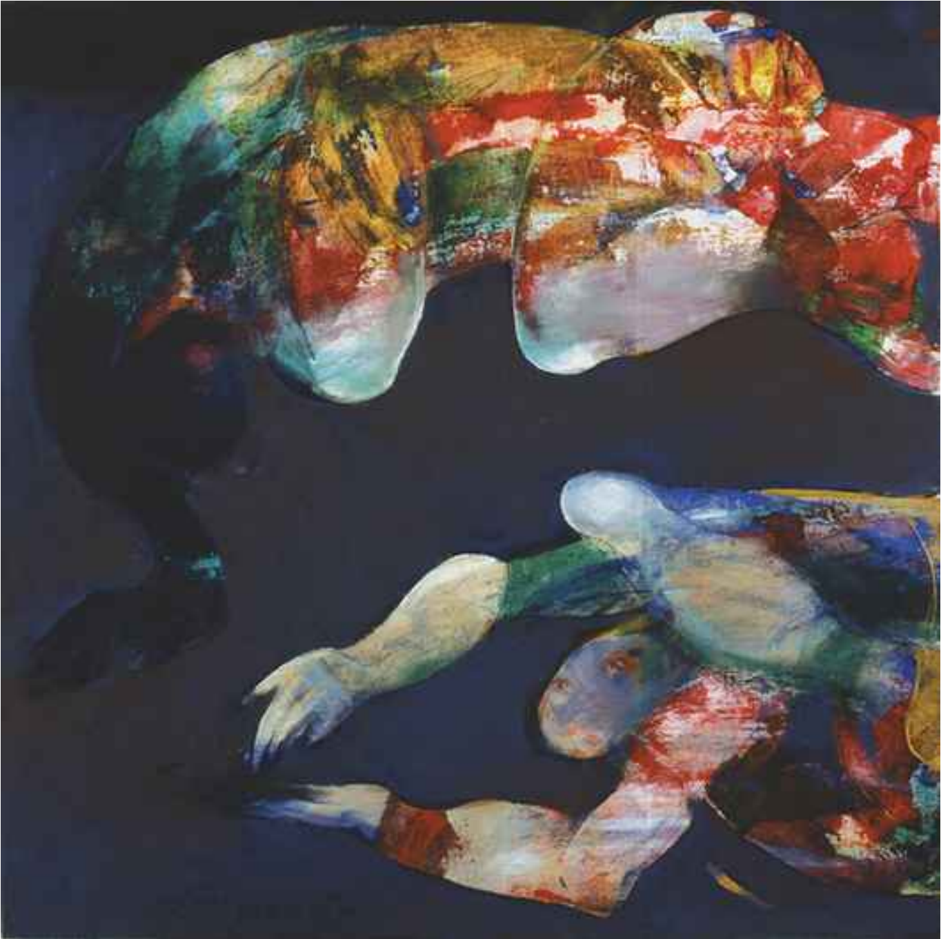
Sinek yakalayanlar,10, 2008, 80x80cm, tuval üzerine karışık.teknik