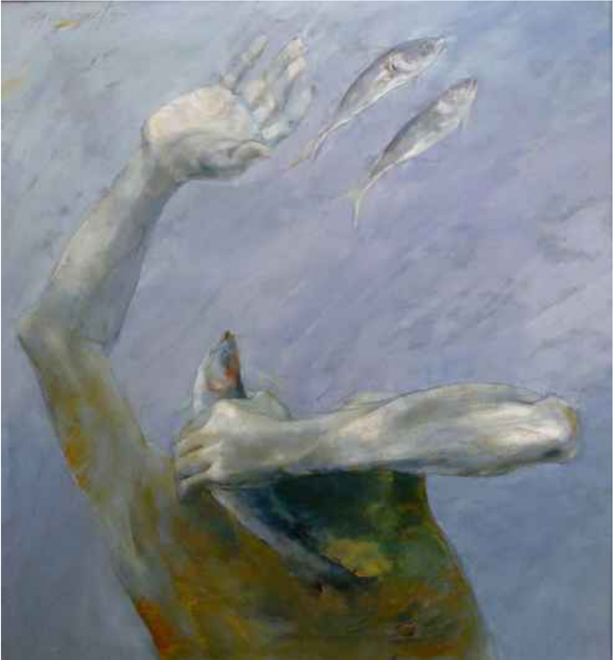
Aşırı sevgi, 1999, 105x97cm., tuval üzerine karışık teknik