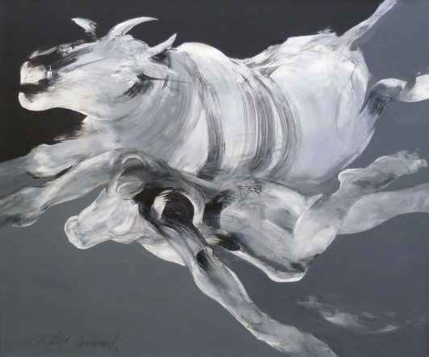
Bosfor efsanesi üzerine düşünceler, 2005, 116x130cm., tuval üzerine karışık teknik