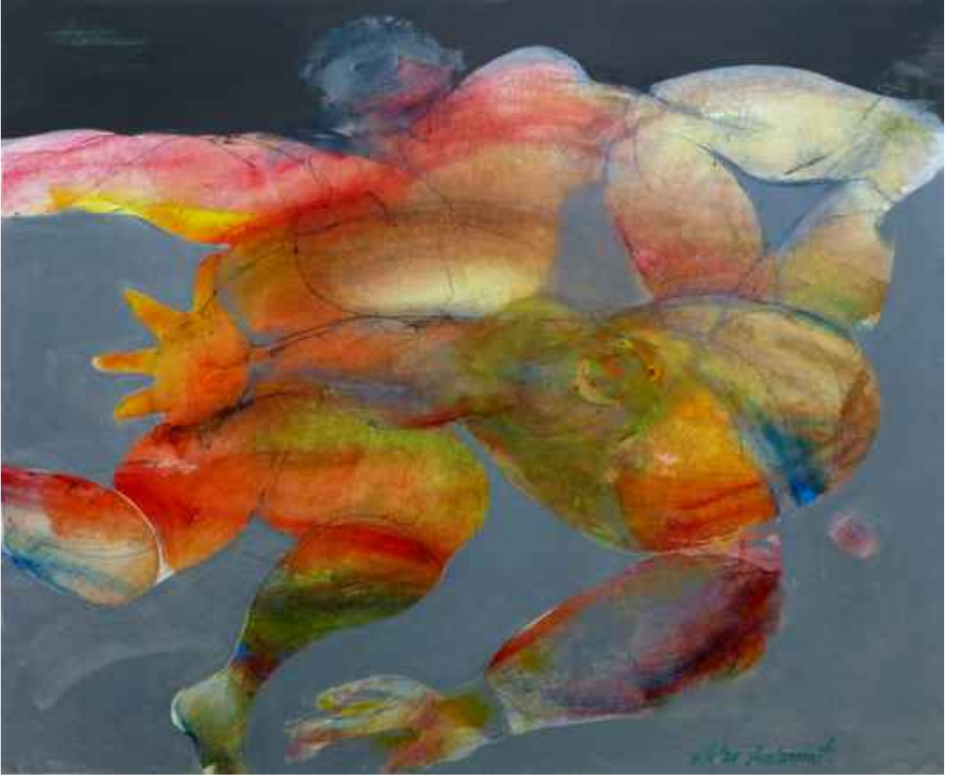
Kurtarış,2004, 97x115cm, tuval üzerine karışık teknik