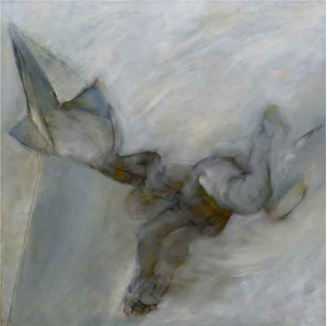
Uçurtma, 2001, 80x80cm., tuval üzerine yağlı boya