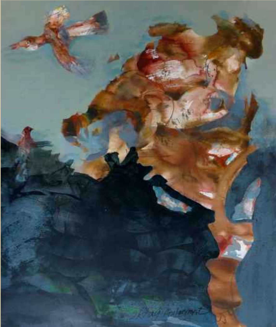
Ağaçlar üzerinde yaşayanlar, 2014, 116x97cm, tuval