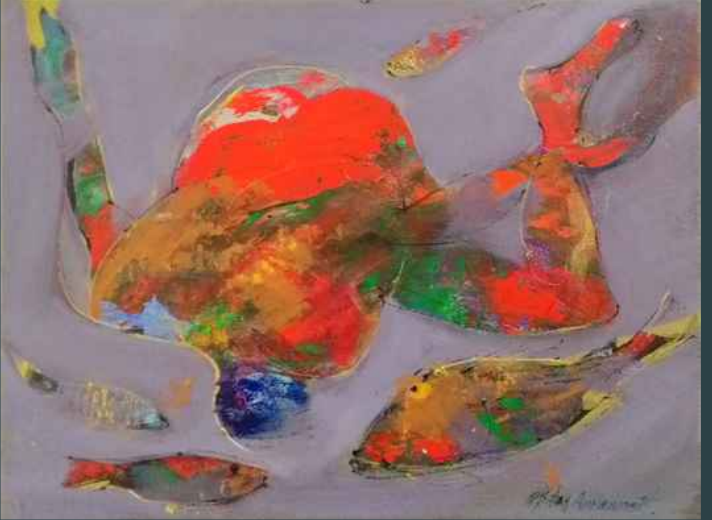
Dolaşanlar,, 22,5x30,5cm., tuval üzerine yağlı boya