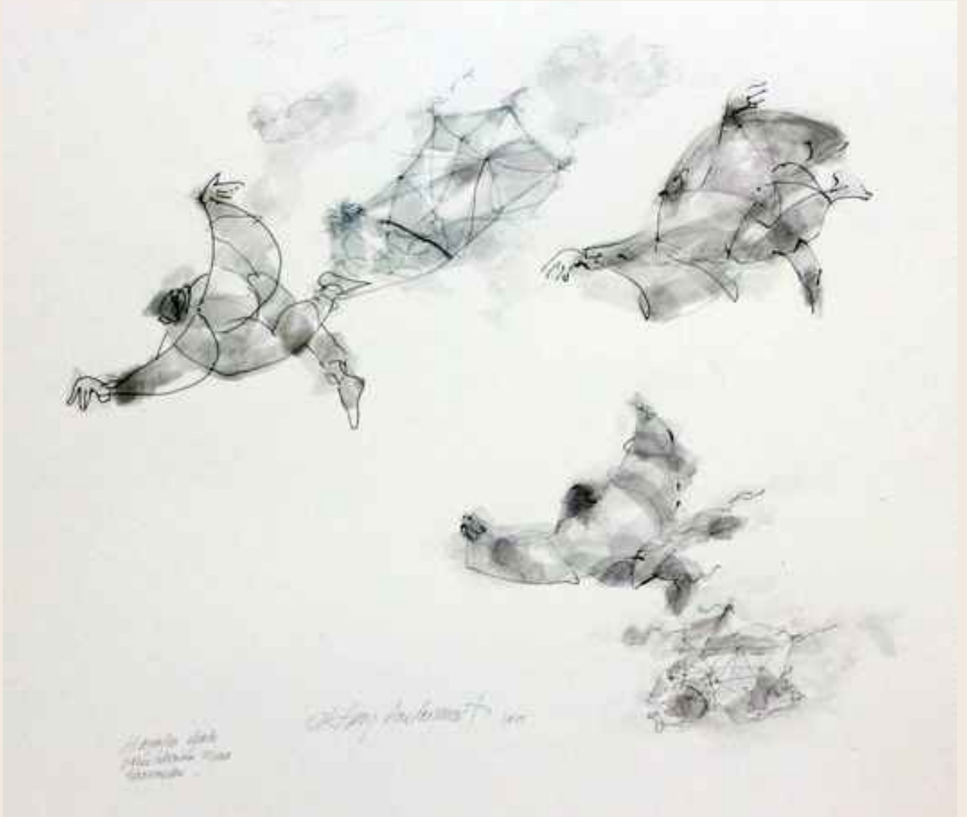
Hazerfen efendi öğrencilerinin uçma denemeleri, 2015, 80x90cm.,