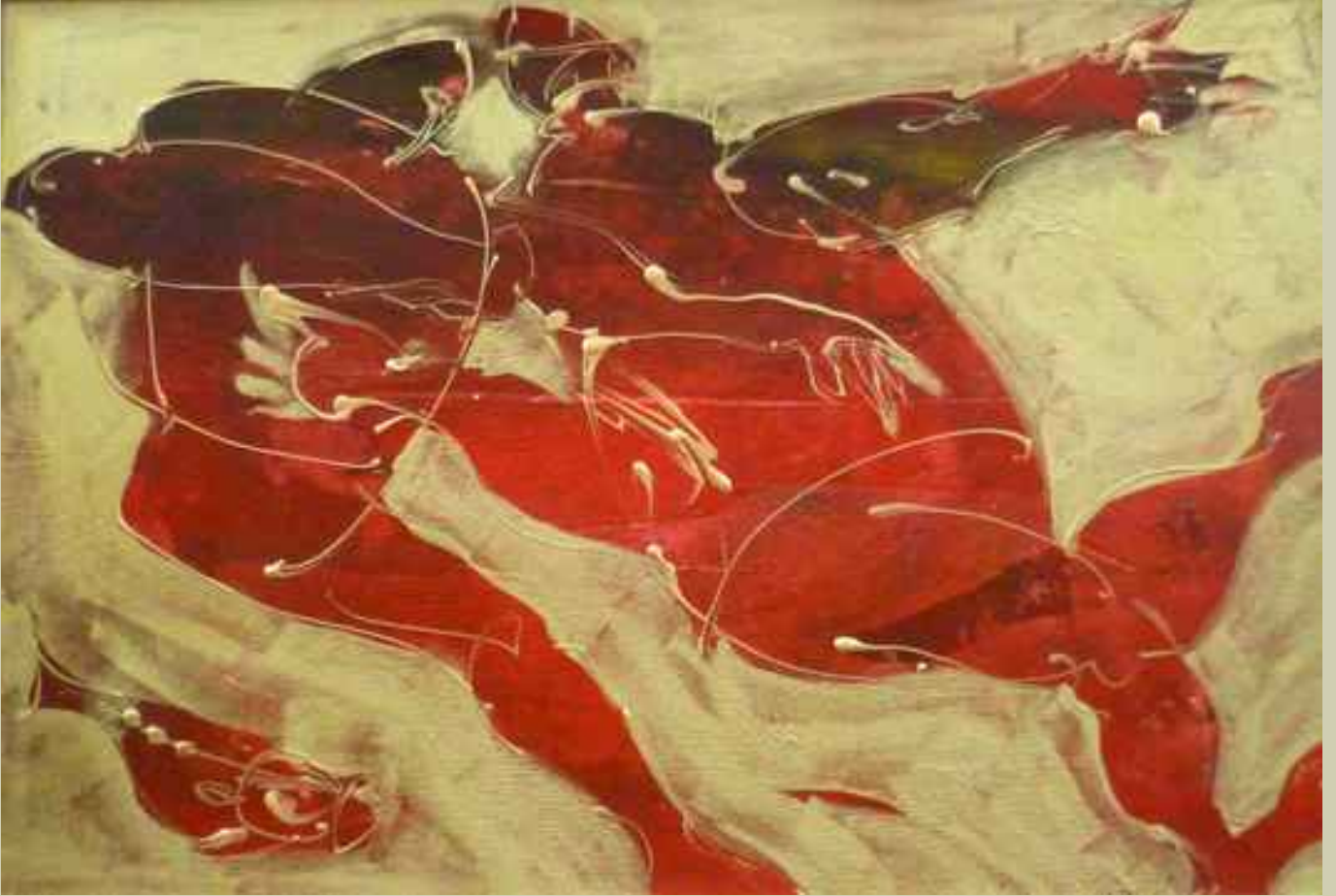
Kovalayanlar 14, 2008, 20x28,5cm., mukavva üzerine karışık teknik