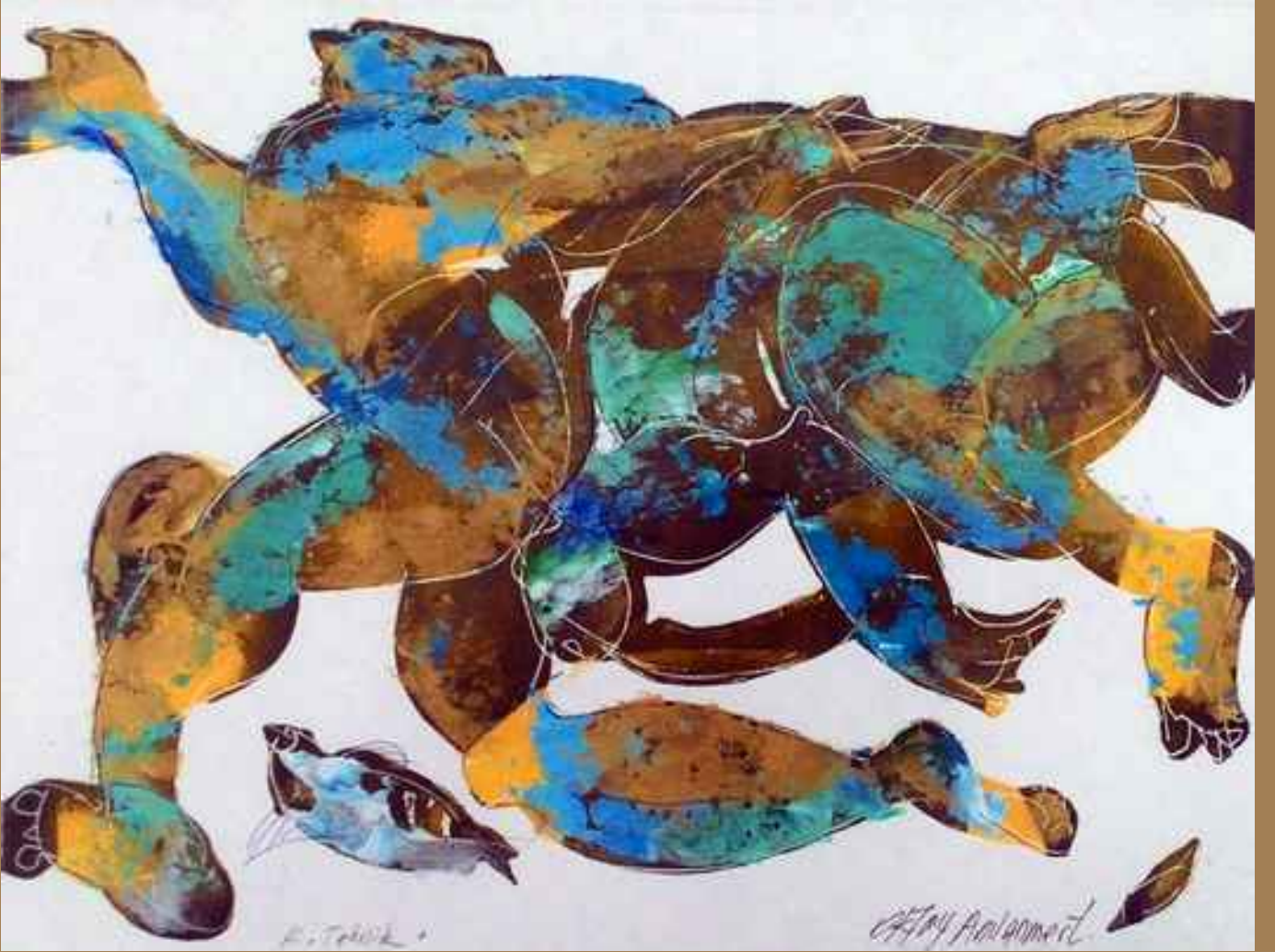
Dolaşanlar 2, 2014, 25x32,5cm., kağıt üzerine karışık teknik