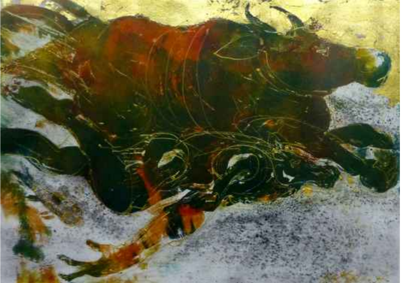
Bosforos efsanesi üzerine düşünceler, 2005, 25x34,5cm., karışık teknik