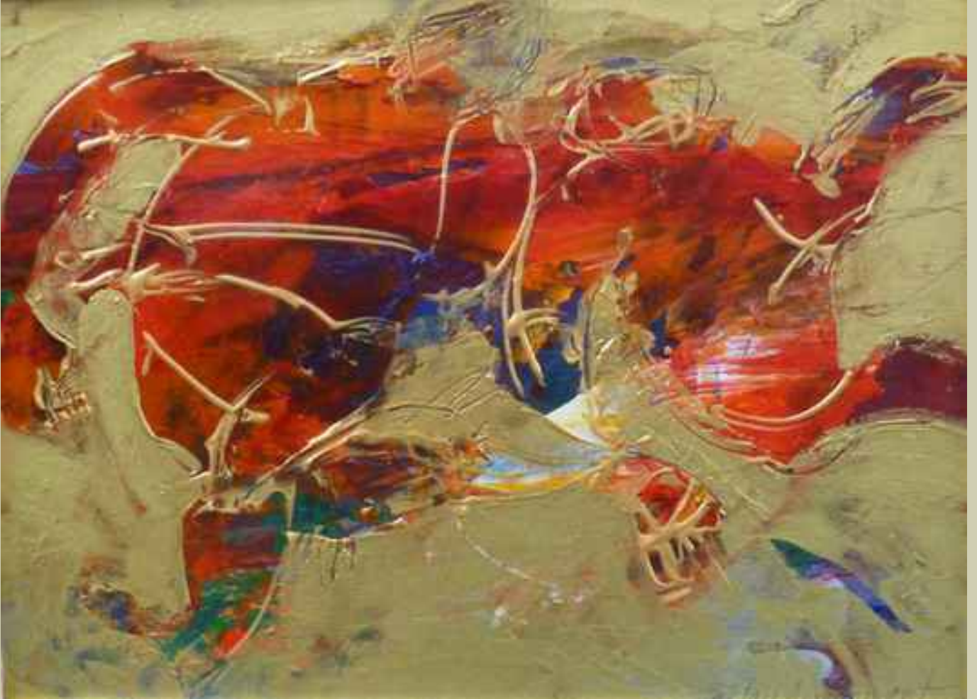
Kovalayanlar 16, 2008, 17x22,5cm., karışık teknik